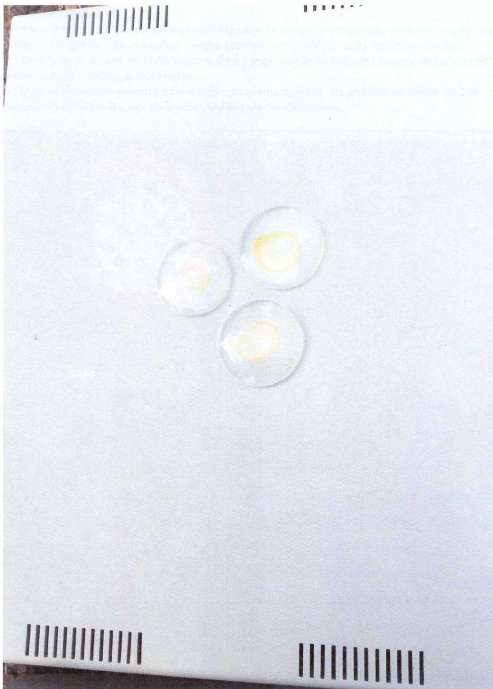
Misao sadrži cilj koncentracije. Dejstvo koncentecije za sadašnje i buduće vreme sprovodi se na senzornom elementu predajnika signala koji se sastoji iz sočiva. Vrši se kružnim kretanjem